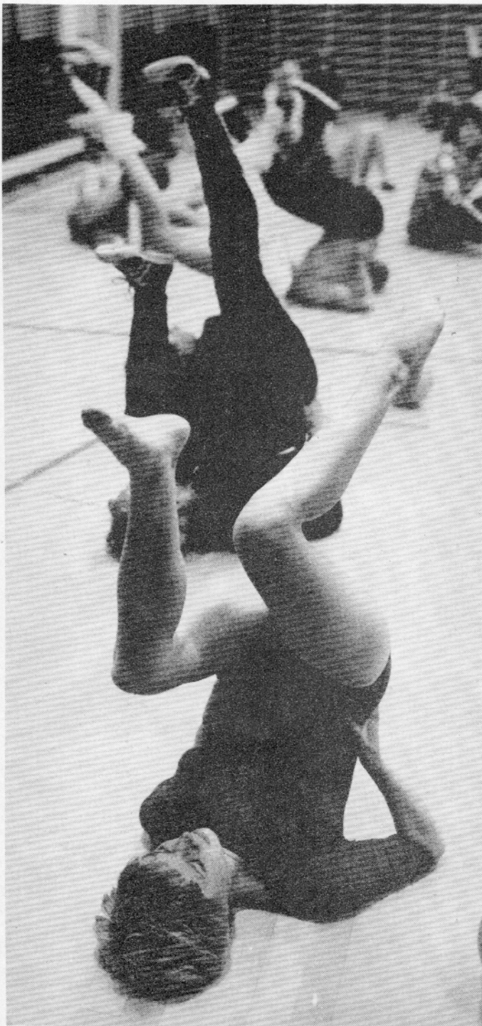
"Avfleskende sykling" på et trimparti.