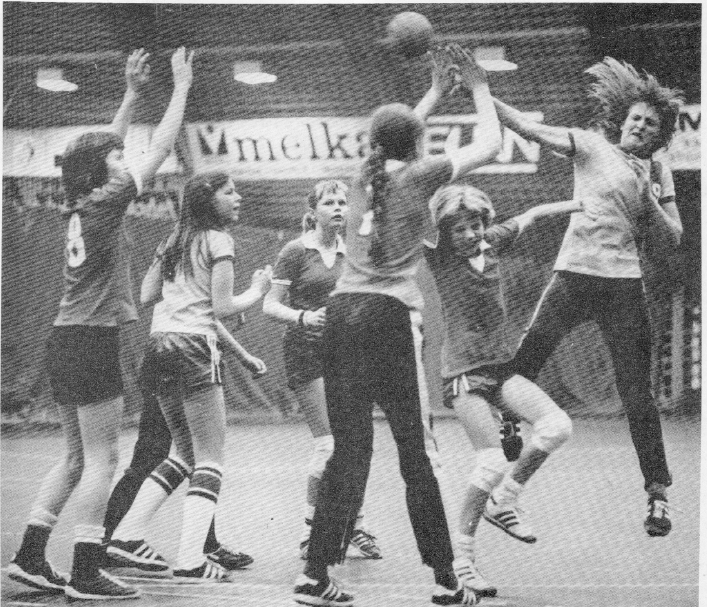
Dramatisk situasjon fra P 11's første finalekamp mot Oppsal If.